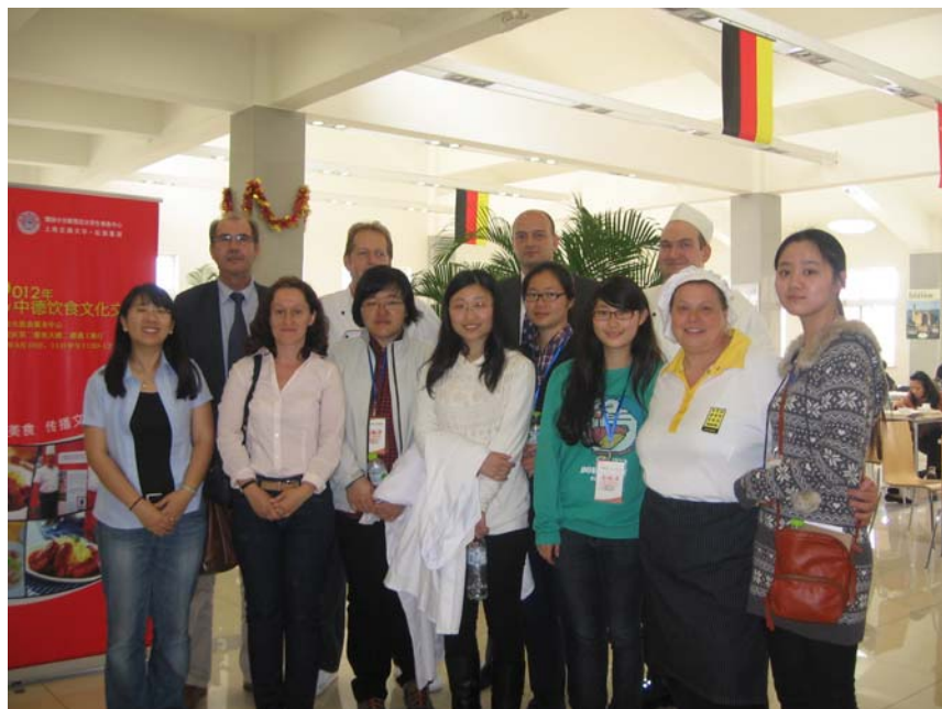
Das Team des Studentenwerks Karlsruhe kocht in China!

Das Studentenwerk Karlsruhe ist ein ambitioniertes Dienstleistungsunternehmen im Hochschulbereich von Karlsruhe und Pforzheim. Mit vielfältigen Dienstleistungen rund um den studentischen Alltag tragen wir maßgeblich zur Attraktivität der von uns betreuten Hochschulen in Karlsruhe und Pforzheim bei. Wir sind Ansprechpartner in allen Fragen rund um das Studium, informieren über die richtige Studienfinanzierung, bearbeiten Anträge nach dem BAföG, sorgen für die Campusgastronomie an acht Hochschulen, bieten psychologische und juristische Beratung an, unterstützen mit studentischen Kindertagesstätten den Studienabschluss mit Kind, vergeben Wohnheimplätze und vermitteln kostenlos Zimmer und Wohnungen privater Vermieter an Studierende.